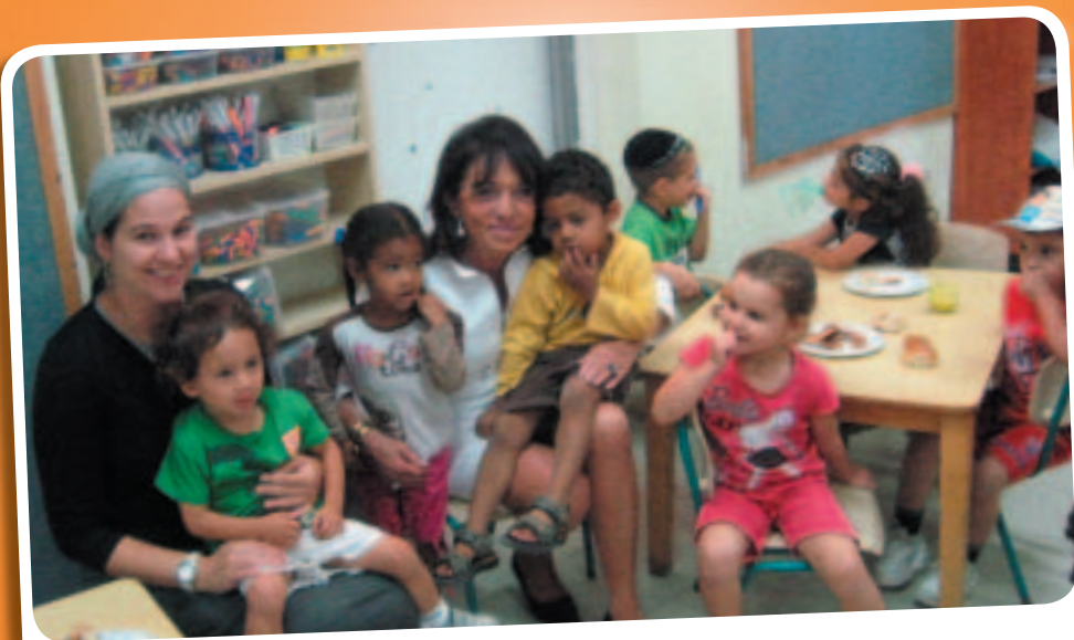
drying little tears

En todo el mundo hay niños sufriendo de hambre y muriendo de inanición o insuficiente atención médica. Es hora de que todos hagamos algo más que estar de brazos cruzados y ver las cosas pasar. Por eso le estamos invitando a hacer una donación ahora mismo y convertirse en embajador de “Secando pequeñas lágrimas”. Cada céntimo se emplea en apoyar los proyectos de la Asociación Regine Sixt “Ayuda a los niños” en los países más pobres del mundo. Unámonos todos bajo el lema “Secando pequeñas lágrimas” y llevemos una sonrisa a los niños.