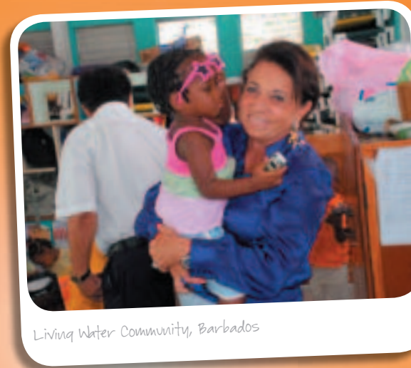
Living Water Community, Barbados

La Asociación Regine Sixt "Ayuda a los niños" va a respaldar a estos niños.