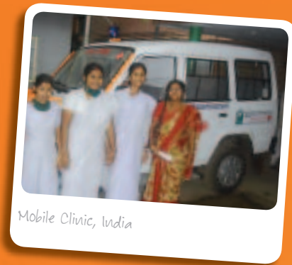
Mobile Clinic, India

Desde 1997 "Médicos a favor del tercer mundo" están atendiendo en sus propios ambulatorios en Kenia, la India, Filipinas y muchos otros países. La iniciativa "Secando pequeñas lágrimas" ha ayudado facilitando clínicas rodantes para este proyecto. Vehículos de Sixt fueron convertidos en consultorios ambulantes para este propósito y se pusieron a disposición de los voluntarios en diferentes lugares. Con ello se asegura ayuda médica rápida, incluso en los rincones del mundo de difícil acceso.