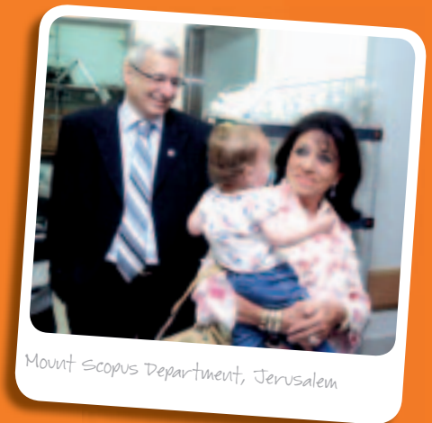
Mount Scopus Department, Jerusalem